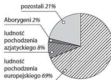
Pochodzenie ludności Australii